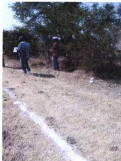
LIMPIEZA Y TRAZO EN EL AREA DE TRABAJO.